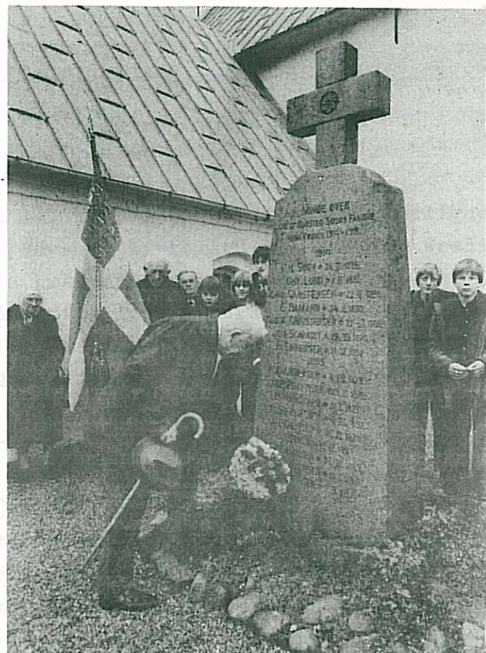
Kransenedlægning ved Mindestenen d.11/11-81.