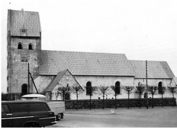
Kirken var midlertidigt ude af brug og en grundig istandsættelse var tiltrængt både udvendig og