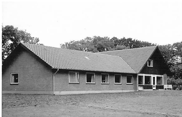
Præstegården set fra sydvest. Haven er gjort klar til beplantning, som blev foretaget i efteråret 1964.