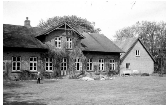
- og fra syd. Th. tilbygning med konfirmandstue m.m.