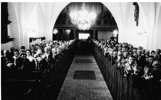
Kirken var fyldt til sidste plads. Mrk. gravstenene i midtergangen og indgangen til ligkapellet i tårnrummet.