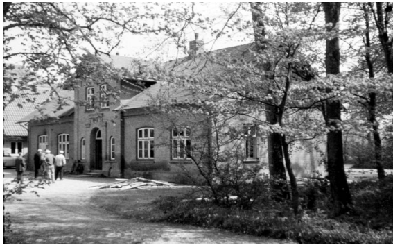
Den gamle præstegård set fra gårdsiden

Præstegården fra 1885 var i en miserabel forfatning. Der var planer om restaurering, så menighedsrådet ønskede ikke, at vi flyttede ind i den. Det var imidlertid meget vanskeligt at finde en anden bolig. I sidste øjeblik lykkedes det at leje nogle lokaler i den såkaldte "Tankcafé" lige ved kirken. Her boede vi, indtil huset blev solgt den 15. august 1963, hvorefter vi flyttede ind i lærerlejligheden i den tidl. tyske skole ("Den hvide skole") nord for kirken. Her boede vi, indtil en ny præstegård var parat den 29. juni 1964.