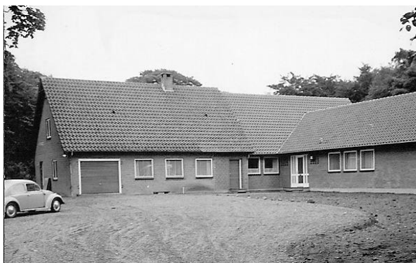
Den nye præstegård 1964 set fra nordvest. Tv. eksisterende tilbygning med garage, fyrrum og bryggers. På bagsiden konfirmandstue med indgang fra gavlen.