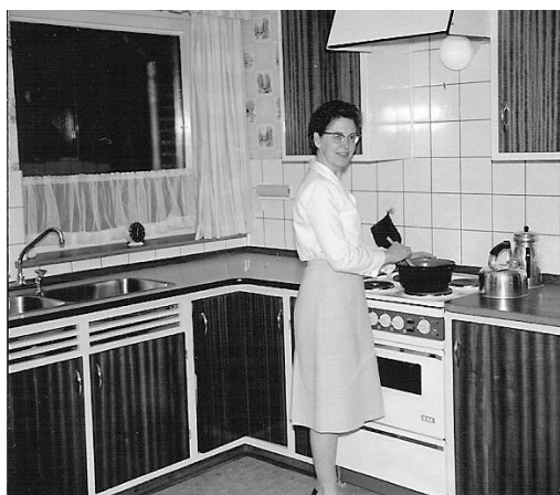
Præstefruen fik et moderne køkken. Inventaret også her fremstillet af snedkerm. W. Kirsten.