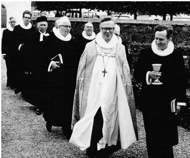
Præsteprocessionen på vej til kirken.