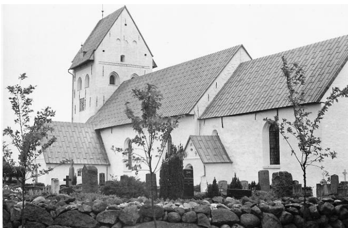
Efter den udvendige restaurering i 1965 lyste kirken igen op i landskabet.